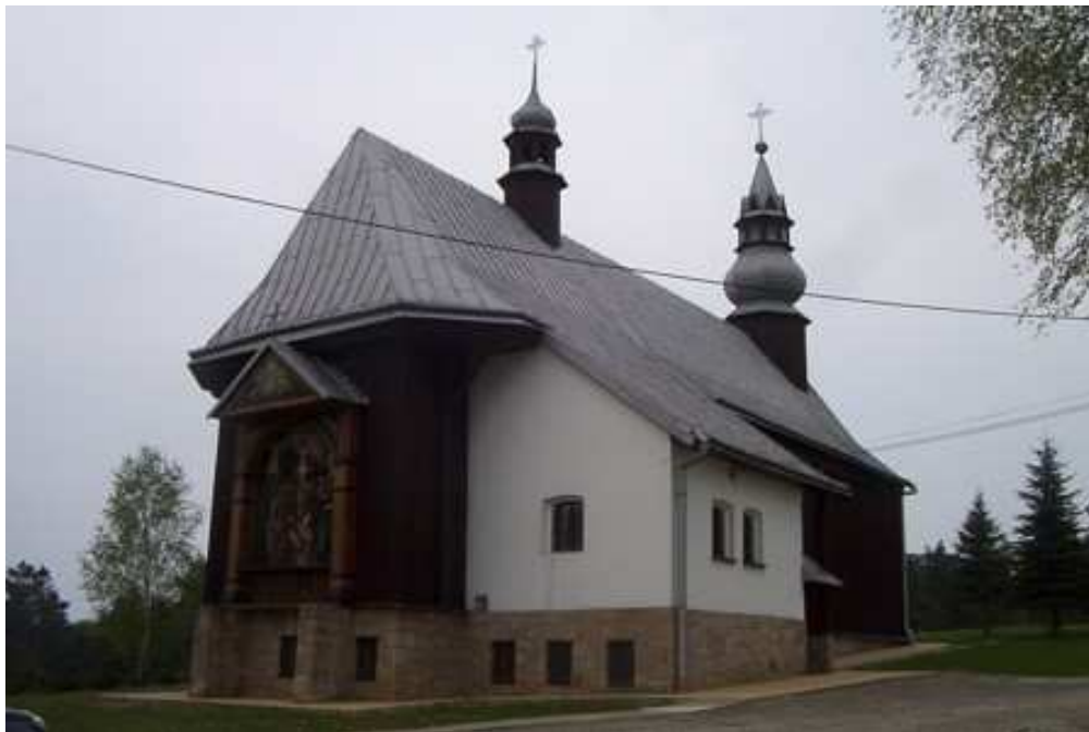
Kościół św. Mikołaja, biskupa

Wcześniej otrzymała od macierzystej parafii zabytkowy kościół drewniany św. Mikołaja pierwotnie stojący w Tęgoborzy. po wykonaniu w Rożnowie zapory na Dunajcu, znalazł się na brzegu Jezioro Rożnowskiego i ulegał podtopieniom. Przeniesiono Go więc do Tabaszowej. Kościół został zbudowany w roku 1753. Ołtarz główny pochodzi z czasu po powstaniu kościoła. W ołtarzu obraz Matki