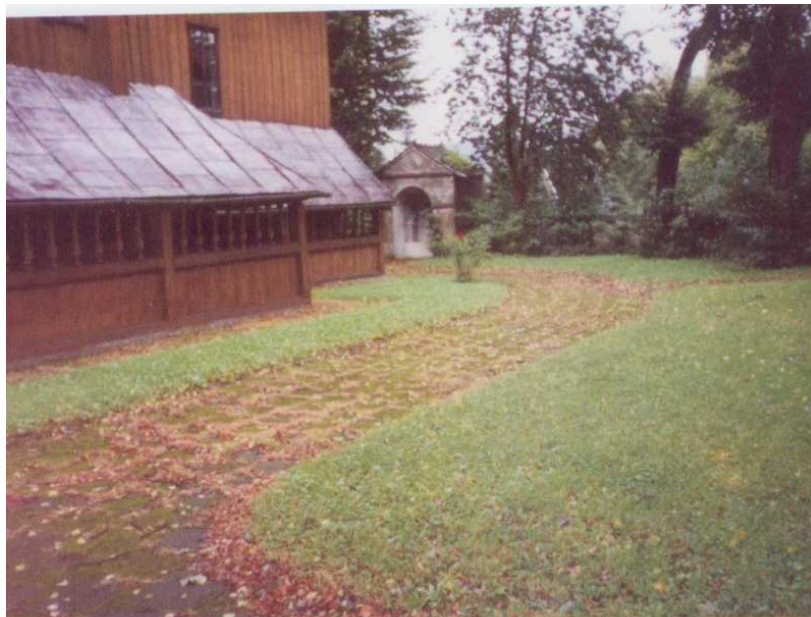
Cmentarz przykościelny starego kościoła. Widoczne soboty przy kościele