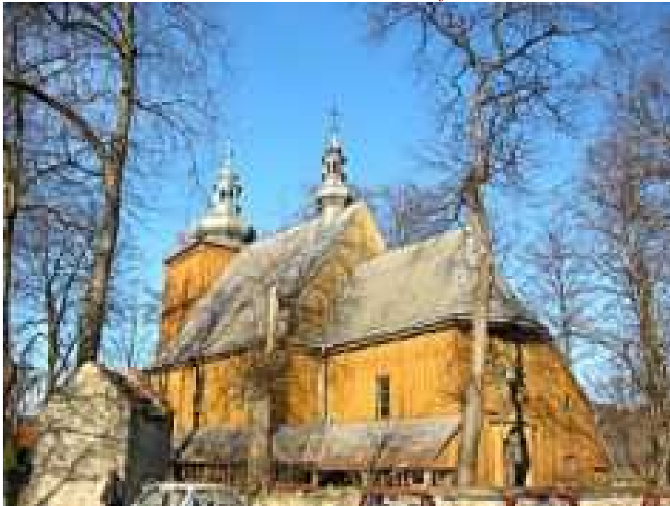
Kościół w Łososinie Dolnej

II kościół został zbudowany w 1739 r., staraniem księdza Piotra Przedborskiego, tutejszego proboszcza. Kościół orientowany, zrębowy, oszalowany. Prezbiterium zamknięte ścianą prostą - rzadkość wśród kościołków małopolskich. Wokół prezbiterium i nawy częściowo oszalowane soboty. Dach dwukalenicowy, kryty blachą. W miejscu połączenia ścian z dachem zaczepy (dawny element konstrukcyjny, stosowany głównie w XV w. - jego obecność tutaj jest dużym zaskoczeniem). Wieża konstrukcji słupowej, zwieńczona izbicą pozorną i baniastym hełmem barokowym.