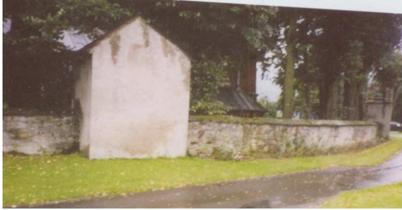
kamenny mur z 1847 r z bramami i pięcioma kaplicami, który otaczał stary kościół i cmentarz przykościelny