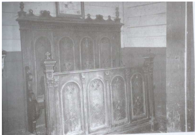
Ławka kłatorska w prezbiterium kościoła