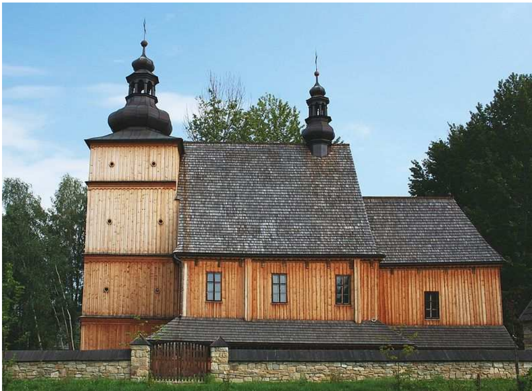
Kościół fososiński, odrestaurowany na nowym miejscu w Muzeum Etnograficznym. Ciekawa jest wieża o lekko pochyłych ścianach, zwieńczona cebulastym hełmem