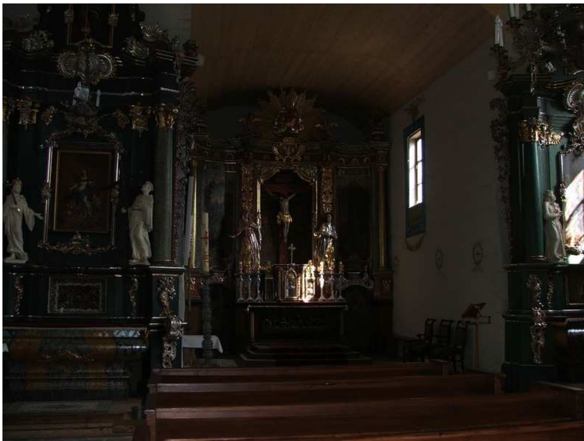
Ołtarze boczne, rokokowe z XVIII wieku. W lewym był obraz Matki Bożej z Dzieciątkiem, gotycki z pierwszej połowy XIV wieku, przeniesiony do nowego kościoła w 1987 r. Polichromia z 1966 r., wykonana według projektu Marii Ritter