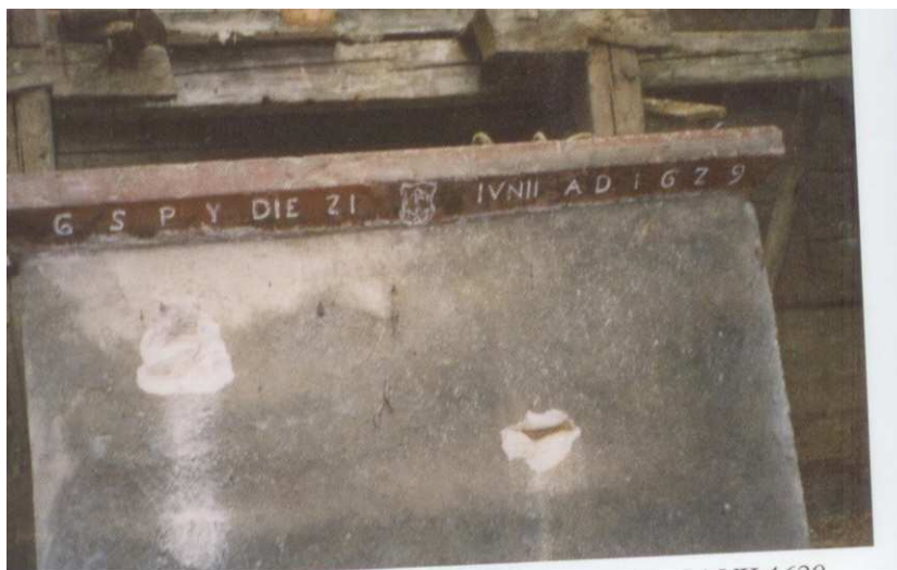
Mensa ołtarzowa z pierwszego kościoła w Jakubkowiecach 1629 r. przeniesiona z kościołem do Skąpsenu