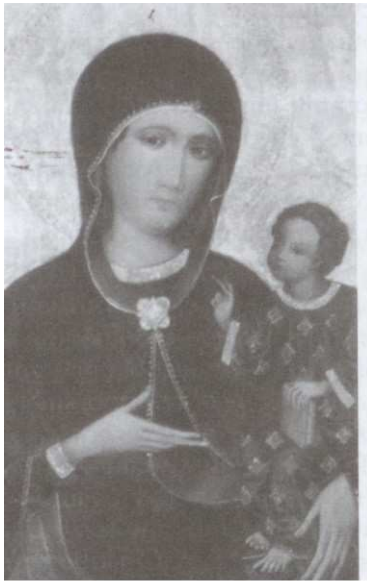
obraz Matki Bożej Pocieszenia z XIV/XV wieku. Malowany na desce w typie Hodegretti, gotycki. Pierwsza wzmianka i znajdującym się w kościele obrazie pochodzi z roku 1608 w sprawozdaniu z wizytacji.