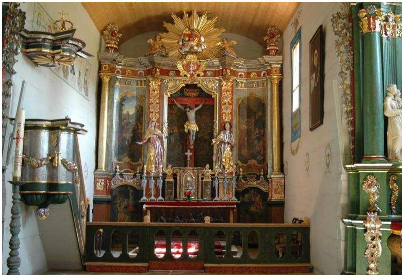
Ołtarz główny późnobarokowy z XVIII wieku z bramkami po bokach: w nim rzeźbiona grupa Ukrzyżowania, ponad bramkami malowidła: wręczenie kluczy Św. Piotrowi i Chrystus ukazujący się św. Pawłowi. Ambona w stylu regencji /XVIII w./