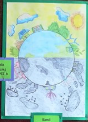
Kami Pierzchała Klasa VII b