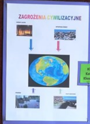
Klaudia Kołodziej Klasa VII b