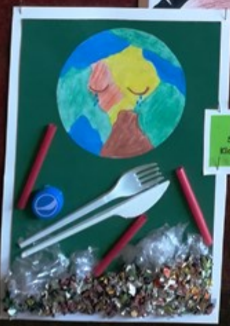
Zofia Solomon Klasa VII a